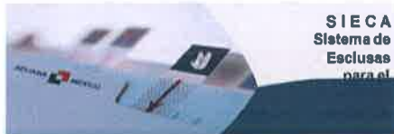
Proyecto Gobierno: SAT - Aduanas Implementación y mantenimiento del SIECA: Sistema de Esclusas para el control de Aduanas"